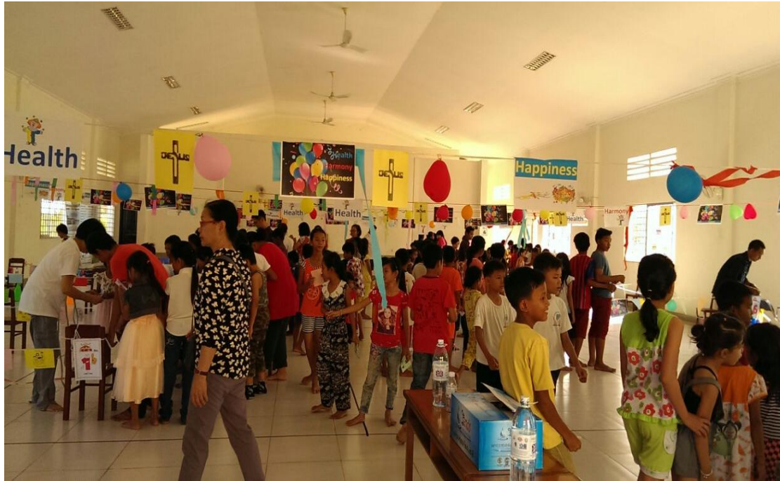
與短宣隊合作籌備健康家庭嘉年華會